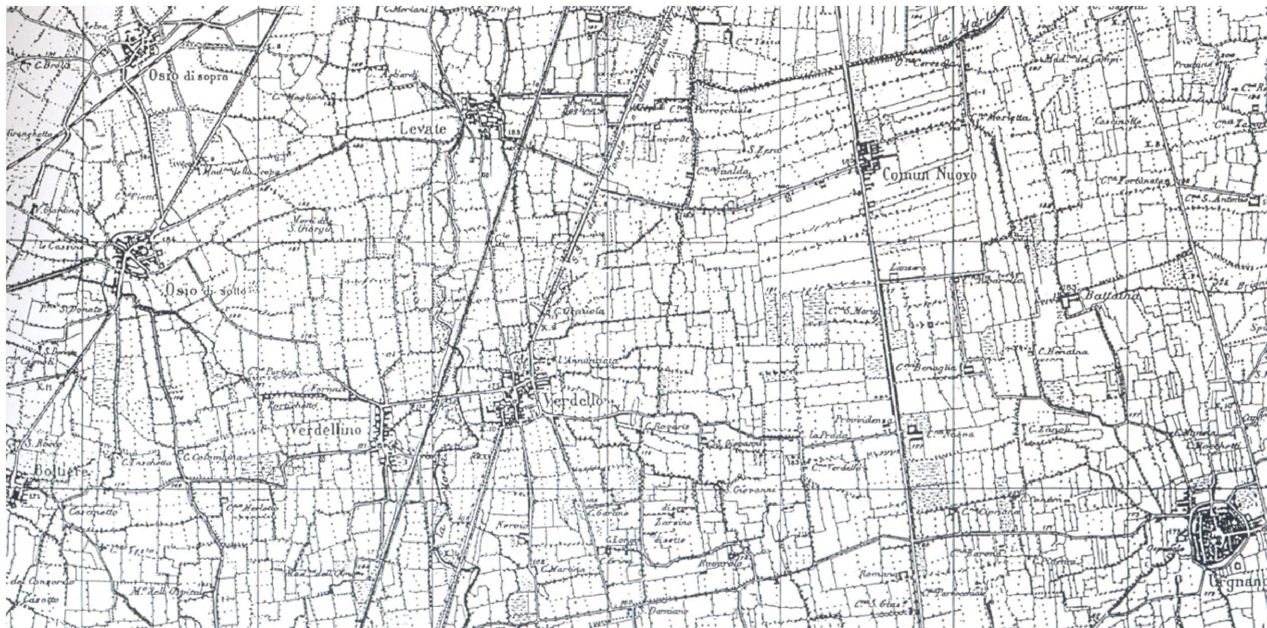
CARTA TOPOGRAFICA I.G.M. DEL 1931 - SCALA 1:30.000