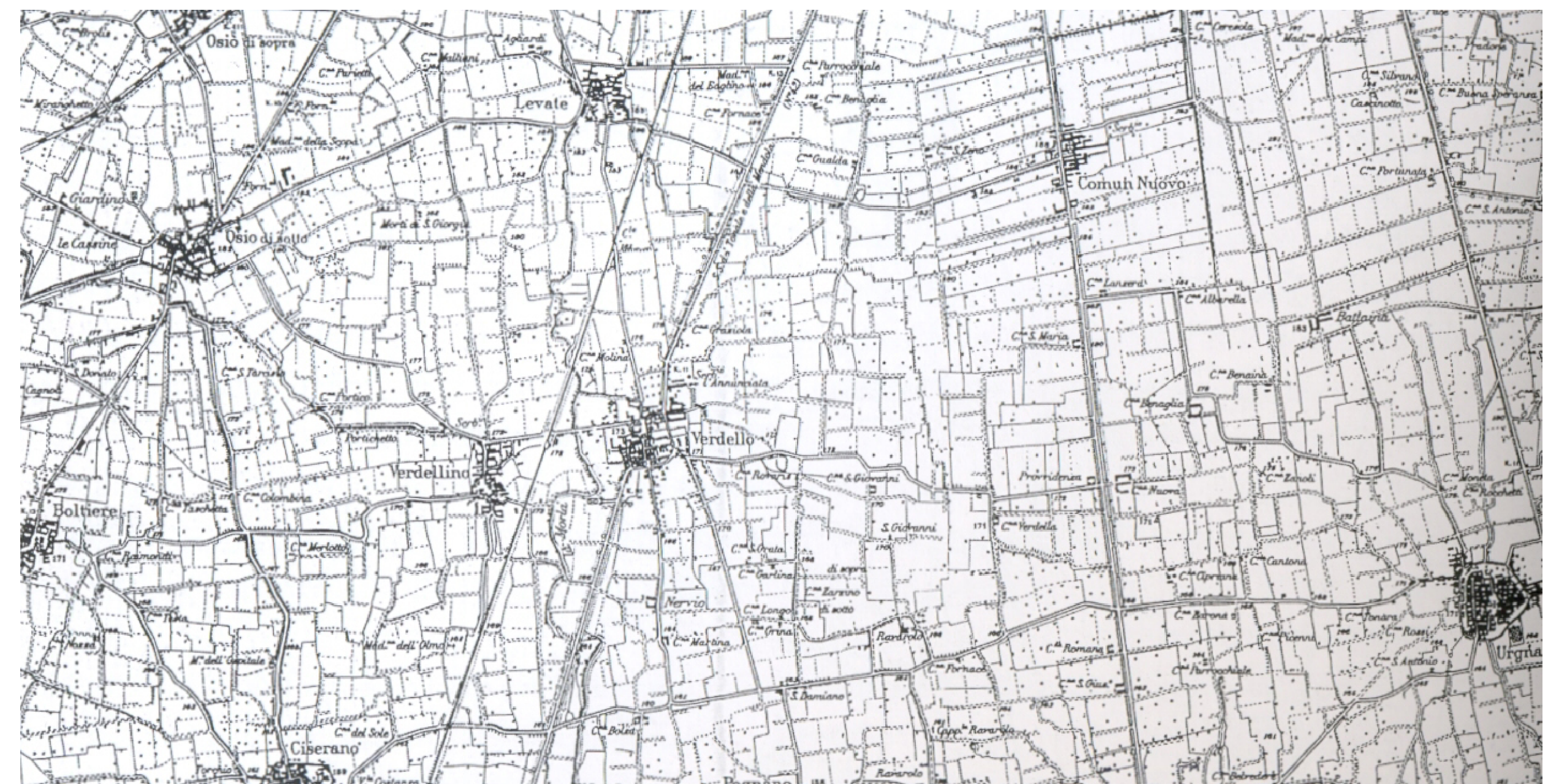
CARTA TOPOGRAFICA I.G.M. DEL 1954 - SCALA 1:30.000