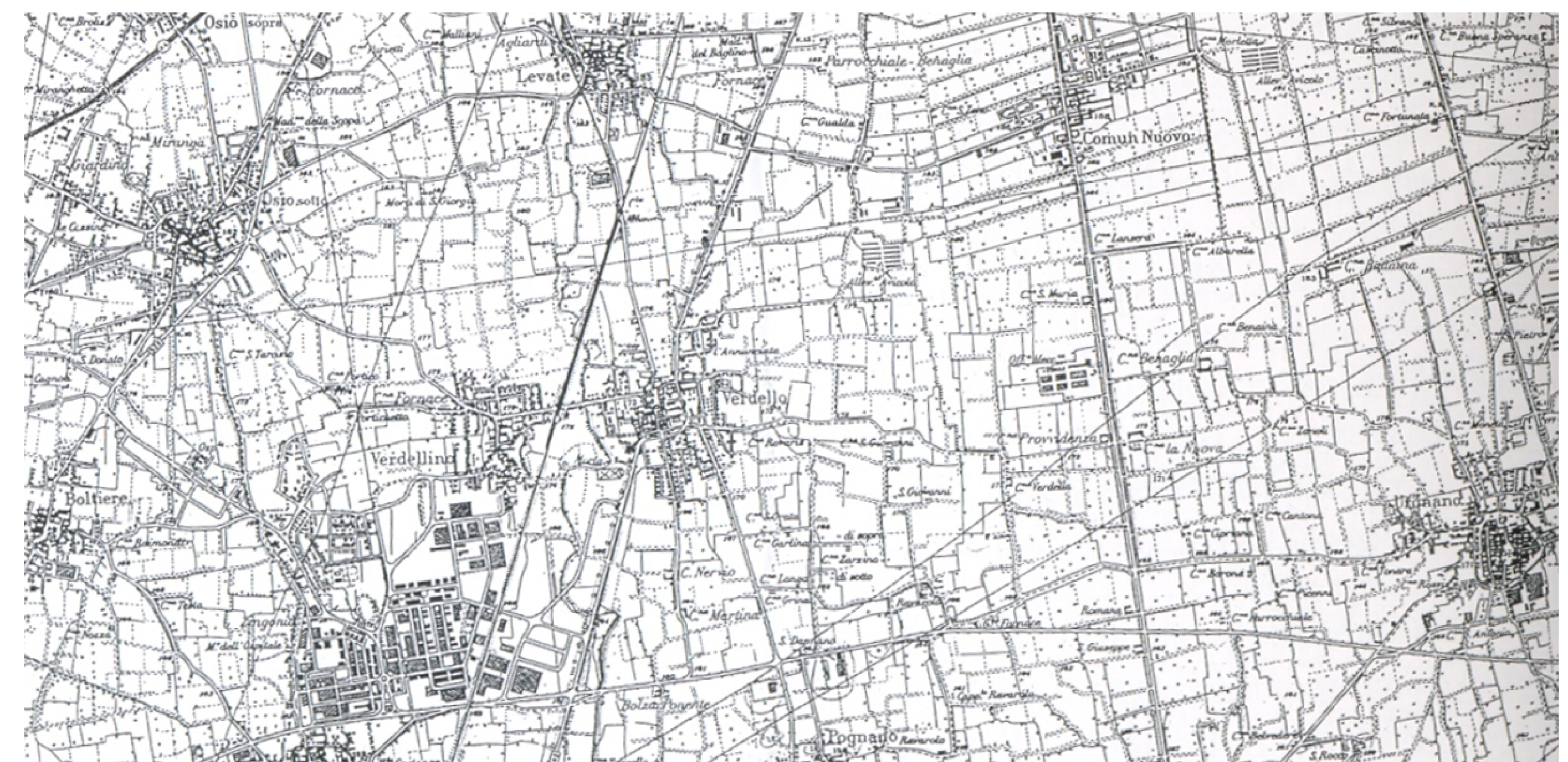
CARTA TOPOGRAFICA I.G.M. DEL 1971 - SCALA 1:30.000

COMUNE DI VERDELLINO PROVINCIA DI BERGAMO