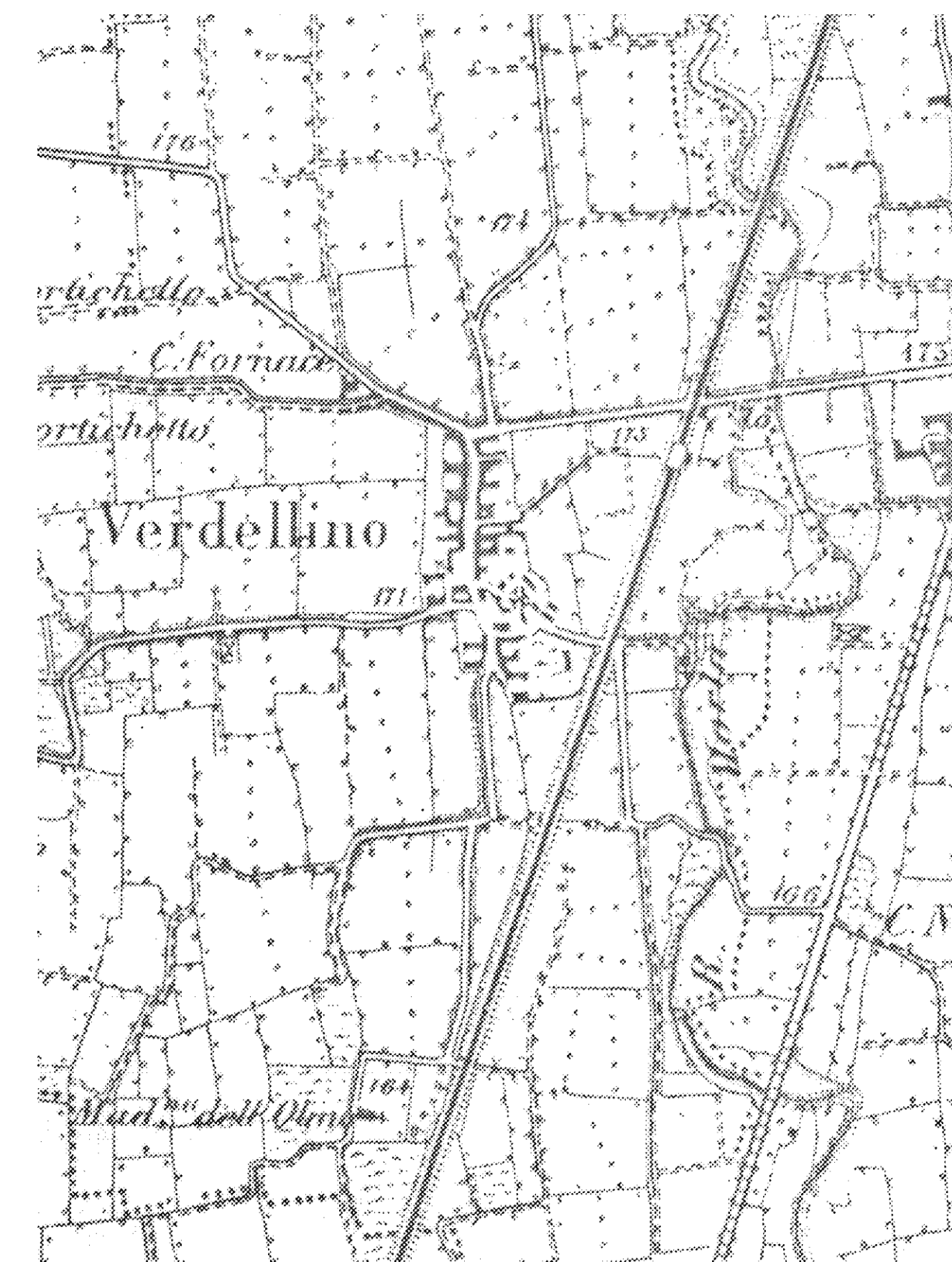
CARTA TOPOGRAFICA I.G.M. DEL 1889 - SCALA 1:10.000