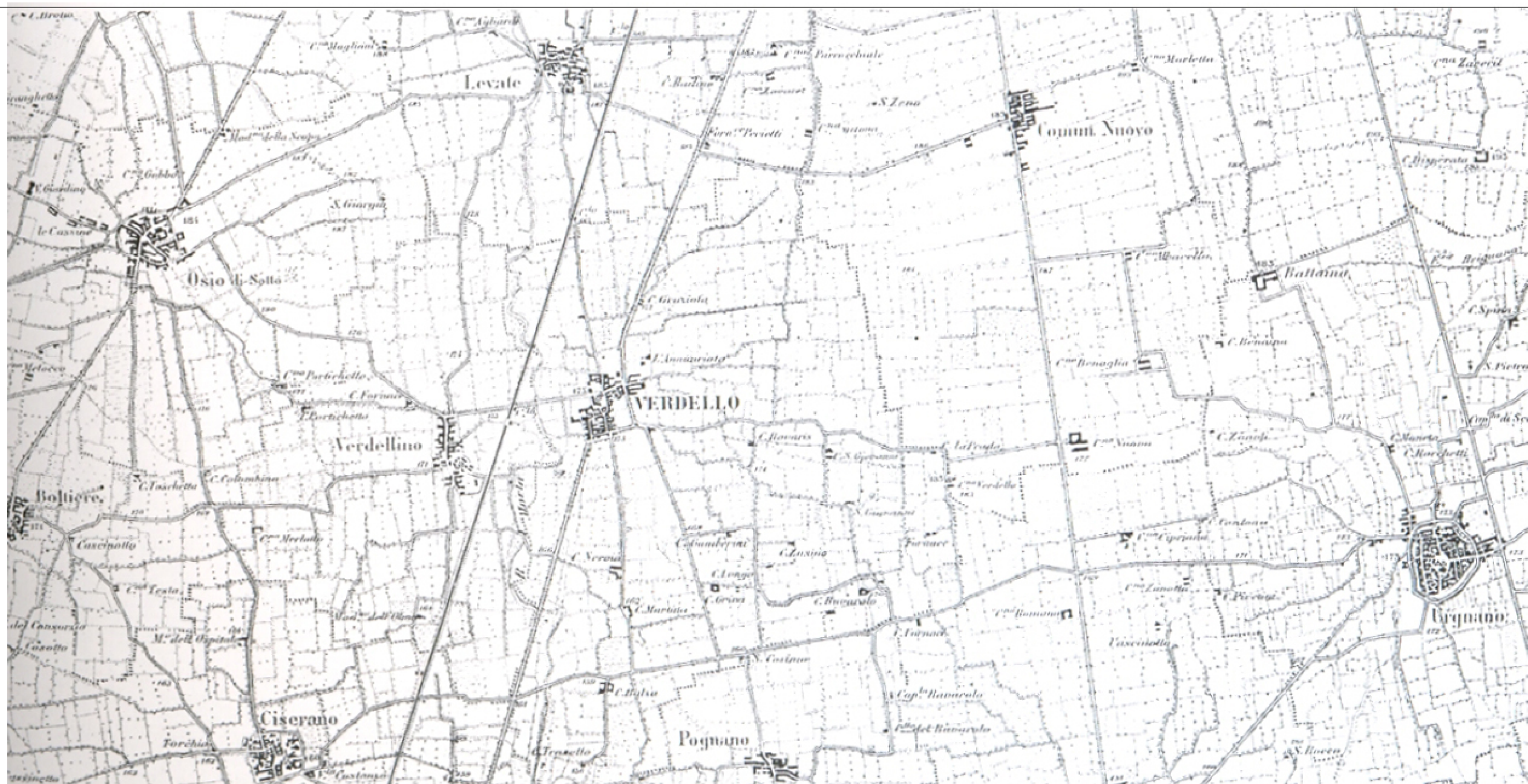
CARTA TOPOGRAFICA I.G.M. DEL 1889 - SCALA 1:30.000